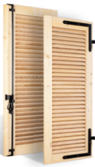
VOLETS BATTANTS 32mm À LAMES À LA FRANÇAISE EN BOIS EN SAVOIR PLUS