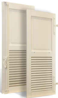
VOLETS BATTANTS GRASSE À LAMES À LA FRANÇAISE EN BOIS EN SAVOIR PLUS