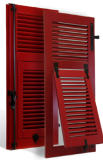
VOLETS BATTANTS NIÇOIS À LAMES À LA FRANÇAISE EN BOIS EN SAVOIR PLUS