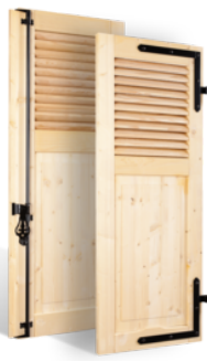
VOLETS BATTANTS 32mm À LAMES À LA FRANÇAISE AU TIERS EN BOIS EN SAVOIR PLUS