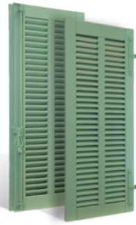
VOLETS BATTANTS MENTON À LAMES À LA FRANÇAISE EN BOIS EN SAVOIR PLUS