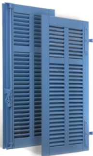
VOLETS BATTANTS CANNES À LAMES À LA FRANÇAISE EN BOIS EN SAVOIR PLUS