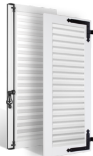
VOLETS BATTANTS 36mm À LAMES À LA FRANÇAISE EN PVC EN SAVOIR PLUS