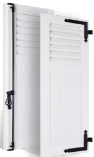
VOLETS BATTANTS 36mm À LAMES À LA FRANÇAISE AU TIERS EN PVC EN SAVOIR PLUS